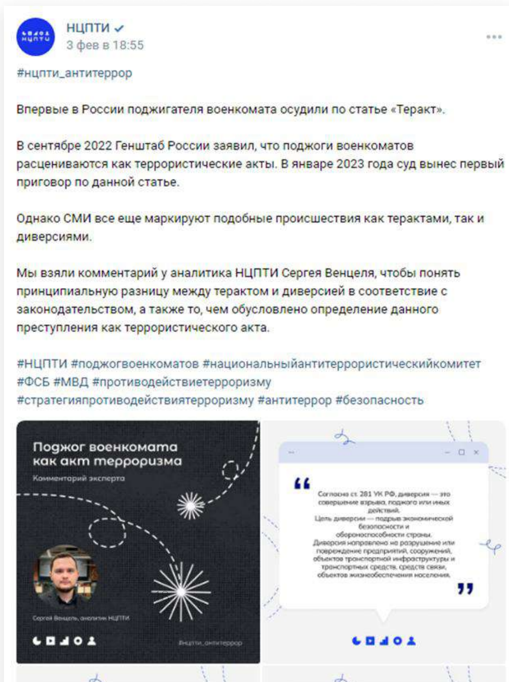
Рисунок 1 — Пример информационного поста в социальной сети